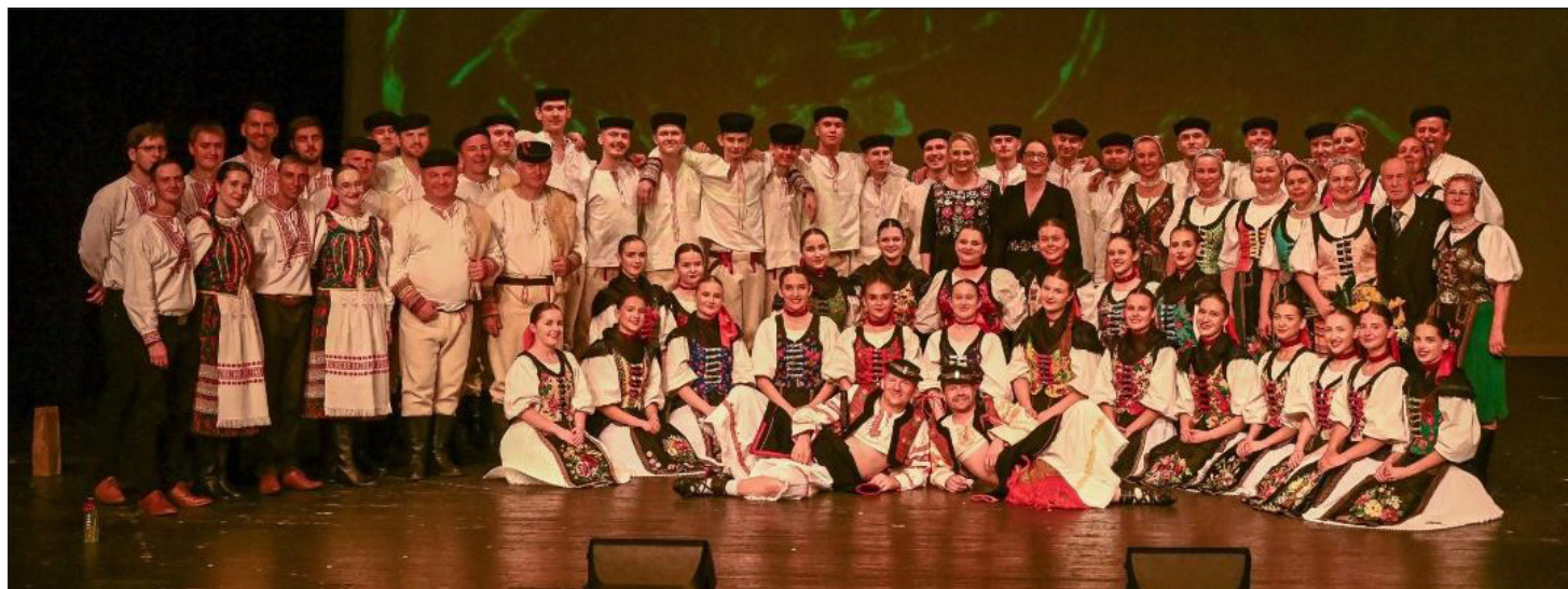
FS Partizán – hudobná, spevácka a tanečná zložka

Od 1. 1. 2018 Partizán pôsobí ako občianske združenie pod názvom FS PARTIZÁN BANSKÁ BYSTRICA v prenajatých priestoroch objektu na Kapitulskej ul. č. 8 v Banskej Bystrici a s podporou MO MS Banská Bystrica aj naďalej v našom matičnom dome na Fortničke. Oficiálne sídlo má združenie na adrese Klenová ul. 14897/1, 974 05 Banská Bystrica - Rakytovce.